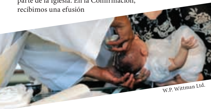
W.P. Wittman Ltd.

❖ Los católicos se fortalecen en su fe y en su relación con Dios a través de los sacramentos. En el Bautismo, nos conformamos en Cristo y nos hacemos parte de la Iglesia. En la Confirmación, recibimos una efusión